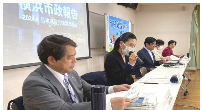
寄せられたご要望・ご質問に担当議員が回答しました