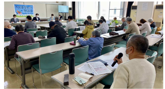
保土ヶ谷区懇談会の様子