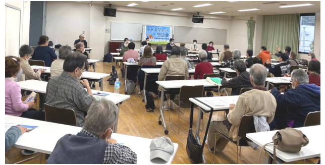
南区懇談会の様子

実現・改善に向けて、議会で役割発揮できるよう頑張ります。今後も出張懇談会を行っていく予定です。ぜひ、ご参加ください。