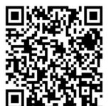
スマホ版アンケートQR