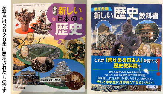
左写真は2020年に展示されたものです